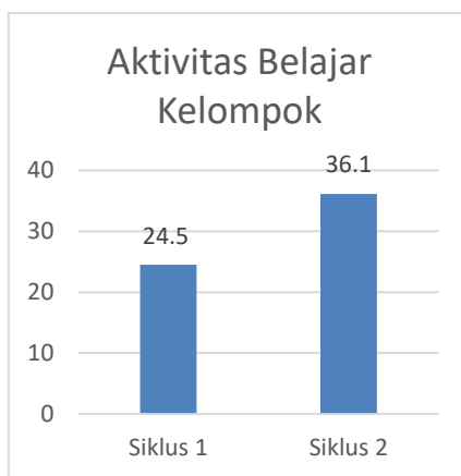
Gambar 2. Peningkatan Aktivitas Belajar Kelompok

Penelitian tindakan kelas yang telah dilaksanakan di SMPN 1 Jombang pada kelas VIII-C melalui penerapan model CORE untuk meningkatkan aktivitas peserta didik selama pembelajaran matematika selama 2 siklus. Berdasarkan hasil perhitungan yang mengacu pada pedoman penskoran pengamatan aktivitas kelompok maupun individu peserta didik di setiap siklusnya, peningkatan aktivitas kelompok ditunjukkan pada Gambar 2 sebagai berikut.