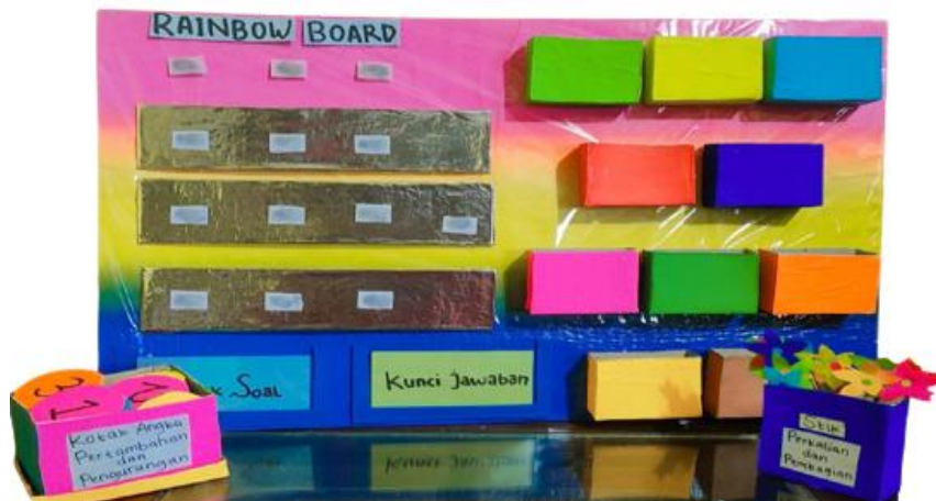
Gambar 1. Media Pembelajaran Rainbow Board

yang memiliki arti pelangi sedangkan Board yang berarti papan. Jadi Rainbow Board adalah media berbentuk papan yang memiliki banyak warna seperti pelangi. Beberapa manfaat dari media Rainbow Board tersebut diantaranya yaitu untuk membantu guru pada saat menjelaskan materi perhitungan, menarik perhatian siswa dalam mempelajari materi perhitungan, serta meningkatkan keaktifan belajar siswa pada materi perhitungan. Adapun penggunaan media Rainbow Board dapat implementasikan secara berkelompok ataupun individu kepada siswa di kelas. Dengan menggunakan media Rainbow Board tersebut, diharapkan bisa membuat keaktifan siswa meningkat lebih aktif pada saat kegiatan pembelajaran khususnya pada pembelajaran matematika.