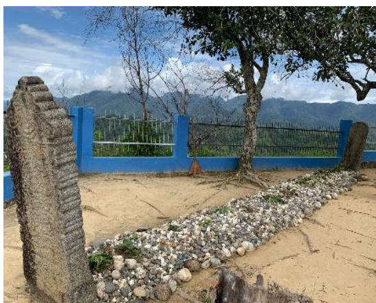
Gambar 1. Makam Syekh Bin Abdurrahman Bin Muadz Bin Jabal

Berdasarkan hasil wawancara yang dihasilkan oleh penjaga makam bahwa makam papan tinggi Syekh Mahmud di Barus ini merupakan salah satu peninggalan bersejarah dimana Syekh tersebut adalah orang yang membantu memperkenalkan Islam ke Indonesia pada abad ke-7. Pada abad ke-13 makam Syekh Mahmud ini ditemukan, dahulunya dikelola dengan buruk karena tidak dirawat dengan baik dan pada saat itu orang-orang belum banyak tahu tetapi lambat laun makam ini mulai diperhatikan oleh masyarakat dan layanan pariwisata dan dikembangkan secara perlahan.