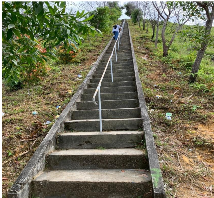
Gambar 3. Anak Tangga

berbeda, namun jumlah anak tangga yang disebutkan di atas merupakan hasil dari perhitungan peneliti sendiri.