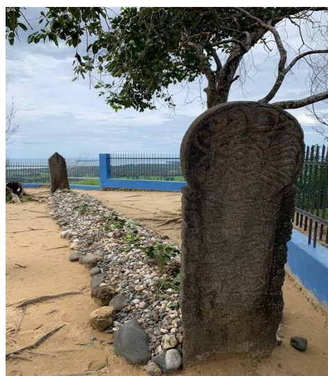
Gambar 2. Batu nisan makam Syekh Bin Abdurrahman Bin Muadz Bin Jabal

Mengenai dimensi nisan bagian kepala memiliki ukuran tinggi 144 cm, lebar 46 cm dan an tebal 13 cm, sedangkan nisan bagian kaki berbentuk pipih segi empat dan puncaknya berbentuk segitiga bergelombang dengan ukuran tinggi 136 cm, lebar 46 cm, dan tebal 13 cm. Dari penjelasan tingi, tebal dan lebar dari kedua batu nisan ini kita dapat menemukan bentuk matematikanya yaitu konsep bangun datar yaitu persegi panjang, segitiga dan lingkaran. Jadi kita dapat menulisnya dalam kalimat matematika yaitu Konsep matematika batu nisan bagian kepala. Konsep Matematika Bangun Datar = Persegi Panjang dan Lingkaran