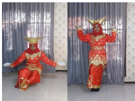
Gambar 7. Gerak Tari Piring Membentuk Konsep Perbandingan

Perbandingan merupakan materi dalam matematika yang membandingkan dua atau lebih nilai dari hal yang sejenis.