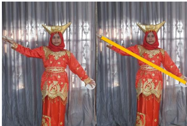
Gambar 9. Gerak Tari Piring Membentuk Sudut Lurus

Sudut lurus didapatkan dari perputaran sebesar setengah lingkaran atau 180^\circ .