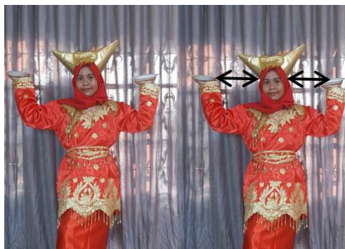
Gambar 6. Gerak Tari Piring Membentuk Konsep Jarak

Jarak merupakan pengukuran numerik yang berguna untuk menyatakan seberapa jauh objek satu dengan objek lainnya.