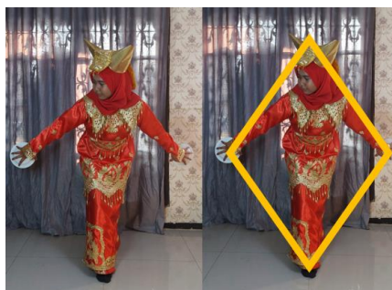
Gambar 11. Gerak Tari Piring Membentuk Bangun Datar Belah Ketupat

Bangun datar ini mempunyai 4(empat) sisi dengan panjang yang sama, memiliki sisi yang berhadapan saling sejajar dan tidak saling tegak lurus.