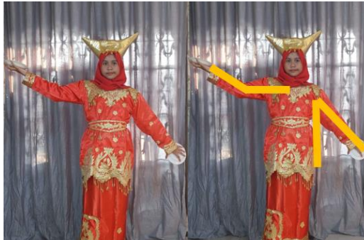
Gambar 8. Gerak Tari Piring Membentuk Sudut Tumpul dan Sudut Lancip

Sudut lancip merupakan sudut yang kecil ukurannya dibandingkan dengan siku-siku, besarnya yaitu antara 0^\circ sampai 90^\circ . Sedangkan sudut tumpul kebalikan dari sudut lancip, karena sudut tumpul lebih besar dari 90^\circ .