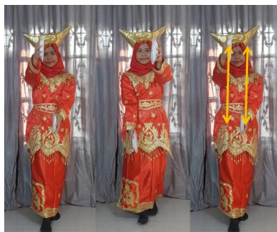
Gambar 12. Gerak Tari Piring Membentuk Konsep Sejajar

Garis sejajar merupakan dua buah garis yang memiliki kemiringan yang sama sehingga sejajar satu sama lain namun tidak saling berpotongan.