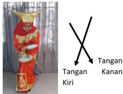
Gambar 3. Gerak Tari Piring Membentuk Garis Bersilangan

Kedua garis dinyatakan bersilangan apabila garis tidak akan berpotongan apabila diperpanjang dan tidak terdapat pada satu bidang datar.