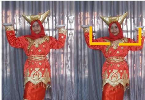
Gambar 5. Gerak Tari Piring Membentuk Sudut Siku-Siku

Pada hitungan ke-4 tangan diangkat kesamping sejajar dengan kepala. Pada siku tangan terbentuk Sudut siku-siku.