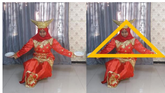
Gambar 4. Gerak Tari Piring Membentuk Segitiga Sama Sisi

Segitiga sama sisi merupakan bangun datar yang ketiga sisinya memiliki ukuran yang panjangnya sama dan sama besar setiap sudutnya.