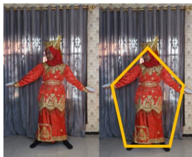
Gambar 10. Gerak Tari Piring Membentuk Bangun Datar Segi Lima

Pada hitungan ke-1 kaki dan tangan dibuka. Jika antara kepala, tangan kanan, kaki kanan, kaki kiri, dan tangan kiri ditarik garis lurus maka terdapat konsep bangun datar segi lima.