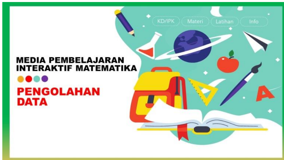
Gambar 3. Halaman menu utama