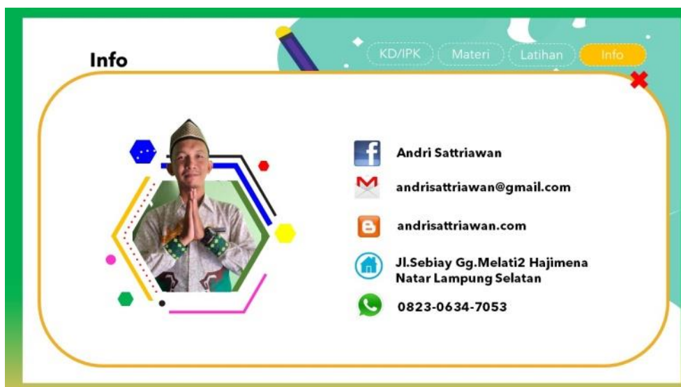
Gambar 9. Tampilan menu info