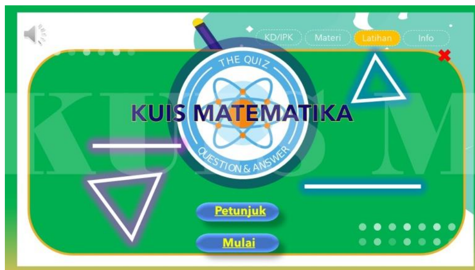
Gambar 6. Pilihan Menu Latihan

Tampilan pada menu latihan di media pembelajaran interaktif ini disisipkan tombol petunjuk dan mulai. Tombol petunjuk akan mengarahkan kepada halaman media yang menjelaskan petunjuk penggunaan untuk menu latihan, sedangkan tombol mulai untuk memulai latihan soal. Pada halaman ini diberikan musik pembuka dan diberikan animasi pada shapes dan font untuk membuat media terasa lebih menarik untuk digunakan oleh peserta didik.