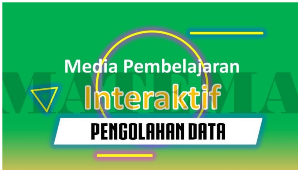
Gambar 2. Halaman Pembuka

Pada halaman pembuka ditampilkan judul dan materi media pembelajaran interaktif dengan ditampilkan beberapa animasi beberapa shapes dan font untuk masuk ke menu tampilan utama. Halaman ini merupakan halaman pertama yang tampil dalam media dan membawa masuk ke menu utama media pembelajaran interaktif.