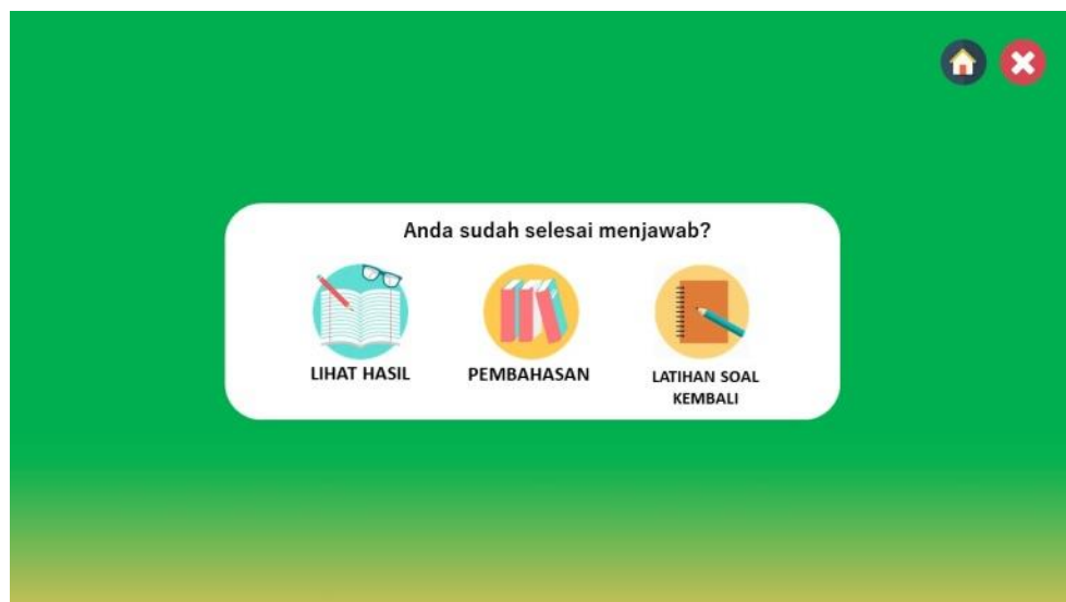
Gambar 8. Tampilan Menu Akhir

Saat selesai menjawab semua soal yang disajikan, maka tampil halaman yang menyajikan tiga tombol yaitu tombol lihat hasil untuk melihat nilai yang telah kita capai saat menjawab soal, tombol menu pembahasan untuk mengetahui bagaimana proses penyelesaian masalah soal yang telah disajikan, dan tombol latihan soal kembali untuk mencoba kembali soal yang telah disajikan. Nampak pada gambar 8.