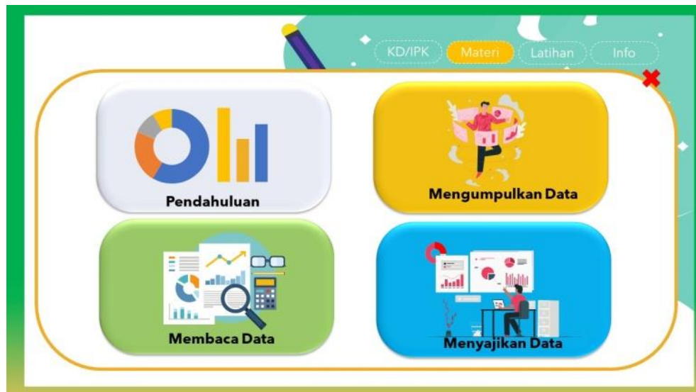
Gambar 5. Pilihan Menu Materi