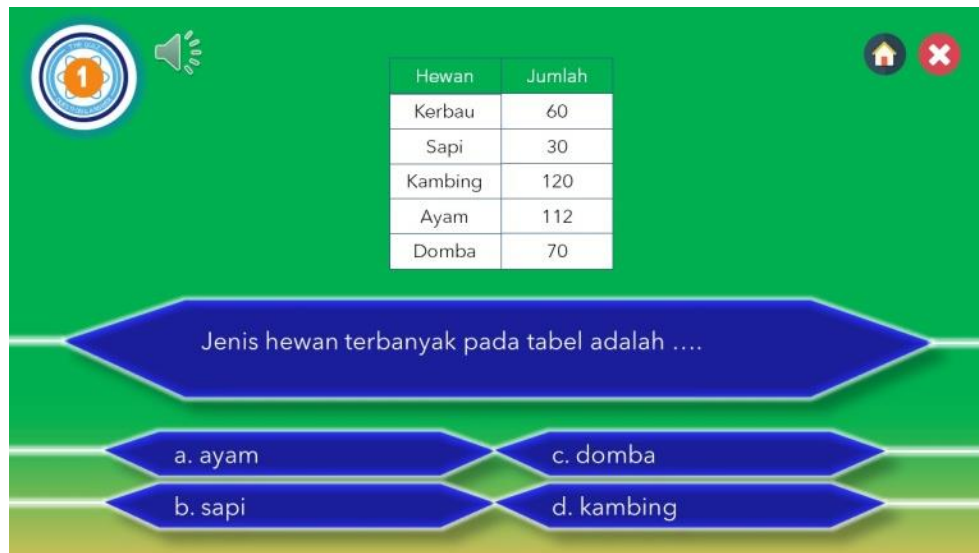
Gambar 7. Tampilan Soal

Saat selesai menjawab semua soal yang disajikan, maka tampil halaman yang menyajikan tiga tombol yaitu tombol lihat hasil untuk melihat nilai yang telah kita capai saat menjawab soal, tombol menu pembahasan untuk mengetahui bagaimana proses penyelesaian masalah soal yang telah disajikan, dan tombol latihan soal kembali untuk mencoba kembali soal yang telah disajikan. Nampak pada gambar 8.