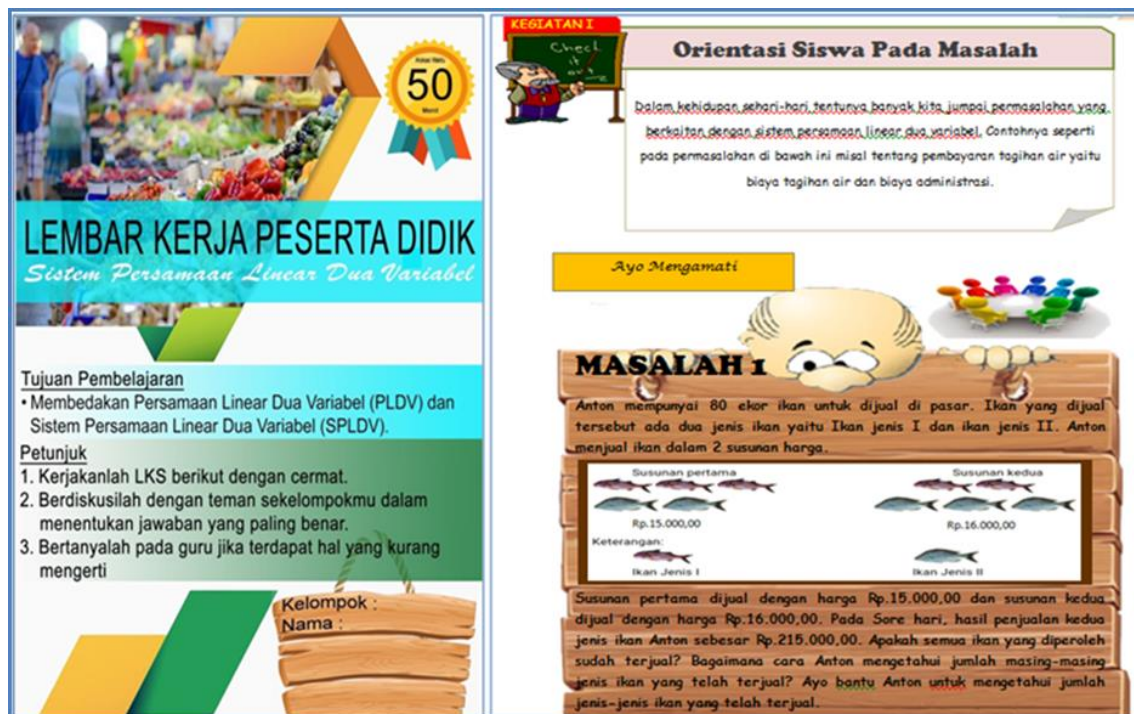
Gambar 1. Bagian Sampul dan Tahap Mengorientasikan Peserta Didik Pada Masalah

Rancangan LKPD pada Gambar 1 merupakan rancangan bagian sampul dan bagian isi LKPD yaitu Tahap mengorientasikan peserta didik pada materi PLDV dan SPLDV. Tahap orientasi peserta didik pada masalah merupakan langkah pertama dari model PBL. Pada tahap ini terdapat perintah untuk mengamati suatu permasalahan yang berkaitan dengan kehidupan sehari-hari. Tahap mengorganisasikan peserta didik, terdapat kegiatan menanya peserta didik menuliskan apa yang diketahui dan yang ditanyakan dari permasalahan yang diberikan. Tahap membimbing penyelidikan kelompok terdapat kegiatan mengumpulkan informasi peserta didik diminta untuk mengikuti kegiatan-kegiatan yang ada pada LKPD agar dapat menyelesaikan permasalahan yang diberikan. Tahap mengembangkan dan menyajikan hasil karya terdapat perintah untuk mengkomunikasikan yang merupakan aktivitas dari pendekatan saintifik. Tahap menganalisis dan mengevaluasi proses pemecahan masalah yang merupakan, peserta didik menyamakan hasil kerja kelompok yang telah mereka lakukan dengan kelompok yang lain. Peneliti selanjutnya menyajikan kembali masalah kontekstual sebagai latihan formatif bagi peserta didik.