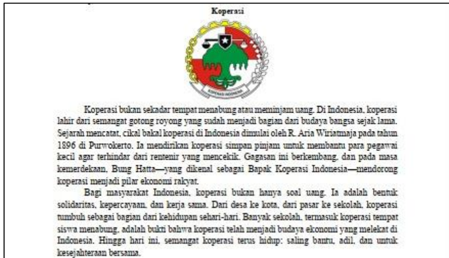
Gambar 1. Koperasi sebagai elemen CRT

sintaks PBL yang terdiri dari 1) mengorientasi peserta didik pada masalah budaya sebagai implementasi CRT, khususnya pada budaya koperasi (Gambar 1), 2) mengorganisasikan peserta didik untuk belajar, 3) membimbing penyelidikan individual atau kelompok, 4) mengembangkan dan menyajikan hasil, 5) menganalisis dan mengevaluasi proses pemecahan masalah, dan diakhiri dengan kegiatan penutup. Bersamaan dengan proses pembelajaran, dilakukan pula observasi terhadap kegiatan guru dan peserta didik oleh dua orang pengamat yakni guru mata Pelajaran matematika sebagai pengamat I dan rekan sejawat sebagai pengamat II.