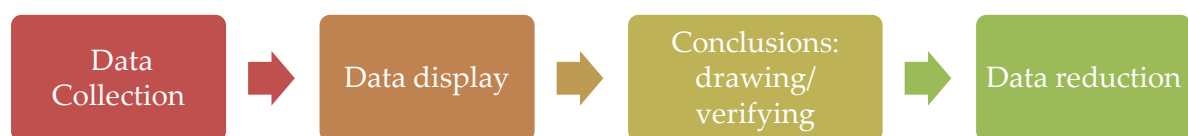
Gambar 1. Model Teknik pengumpulan data dan analisis data secara Interaktif

Teknik analisis data yang digunakan ialah Model Miles dan Huberman, analisis data dilakukan pada saat pengumpulan data berlangsung, dan setelah selesai pengumpulan data dalam periode tertentu. Miles and Huberman (1984), mengemukakan bahwa aktivitas dalam analisis data kualitatif dilakukan secara terus menerus sampai tuntas, sehingga datanya sudah jenuh. Aktivitas dalam analisis data, yaitu data reduction, data display, dan conclusion drawing/verification (prof.Dr.Sugiono, 2013).